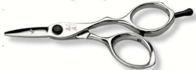
HACHIDORI / Japanisch für "Kolibri" 4.25 Inch

Das kleinste Mitglied unserer Familie! Mit seinen extrem kleinen Klingen machen wir es zum ultimativen Werkzeug, um Bewegung im Haar zu erzeugen, ohne das Risiko, zu viel Haar auf einmal zu entfernen. Das Ausdünnen, Konturieren und Freihand-Texturieren war noch nie so angenehm. Aufgrund seiner perfekt abgewinkelten unteren Klinge sorgt HACHIDORI für die präzise Ausführung, wenn Sie trockenes und nasses Haar schneiden. HACHIDORI wird mit einem speziell angefertigten Beutel geliefert, den Sie um den Hals tragen können.