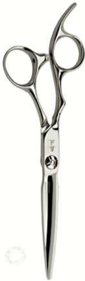
TSURU (BB) 5.5" & 5.8"