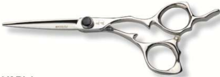
YARI / Japanisch für "Speer" 5.5 Zoll.

Es ist ein akribisch gefertigtes Kraftpaket, das als „Must-ve“ für detaillierte Arbeiten und durchgezogene Linien entwickelt und ist ein Traum, mit dem Sie arbeiten können. Das ergonomische Design mit leicht verdrehten Griffen sorgt für eine natürlichere, entspanntere Haltung, da Sie mit gesenkter Schulter und gesenktem Ellbogen arbeiten können. Yari hat auch eine Einstellung der Torsion und eine feste Fingerauflage.